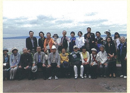
■文学散歩 観音崎にて