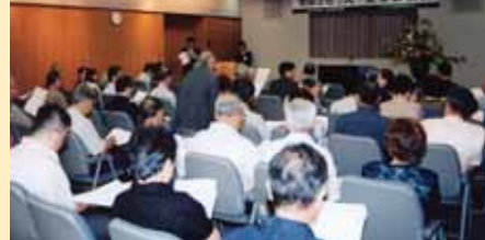
■松本清張記念館友の会主催 講演会