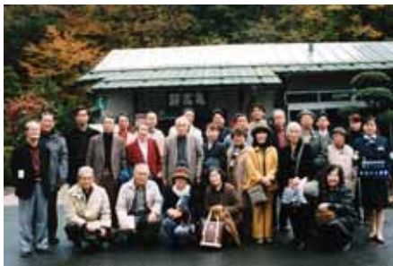
■「砂の器」の舞台 鳥取県亀高駅にて