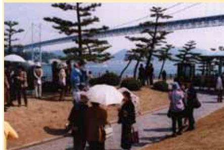
■文学散歩 関門海峡(みもすそ川公園・下関市)にて