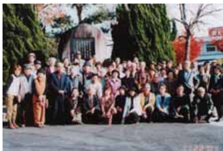
■文学散歩 文学碑(安心院)の前で