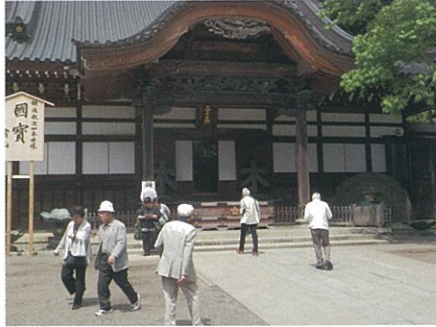
■文学散歩 深大寺にて